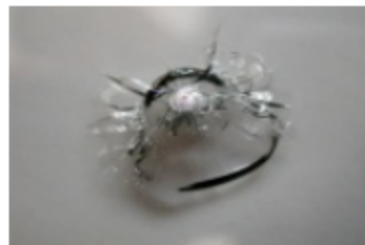
图4 牛眼/星型复合形状破损