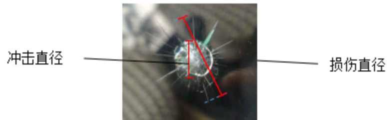
图 5 冲击直径与损伤直径